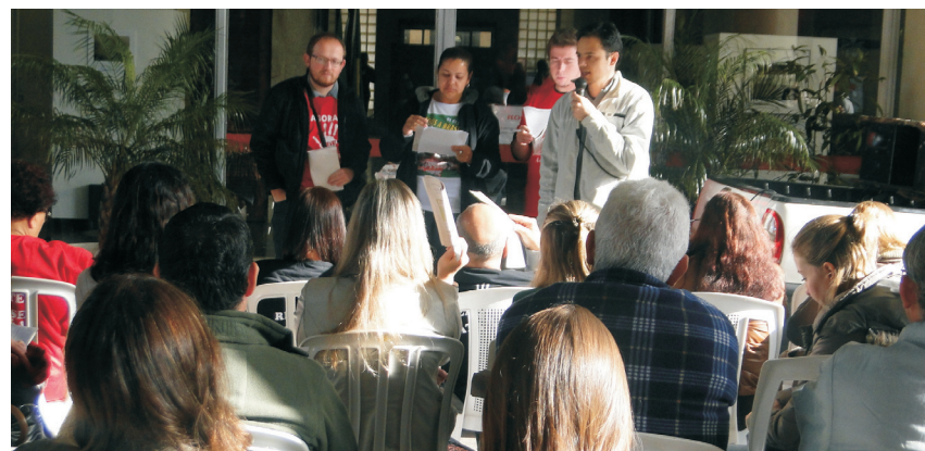
CLG em atividade no aeroporto em Porto Alegre, dia 19 de junho.