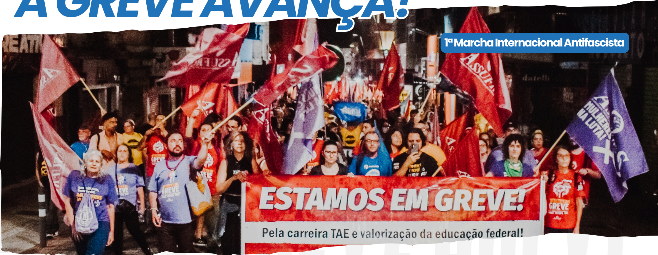
1ª Marcha Internacional Antifascista