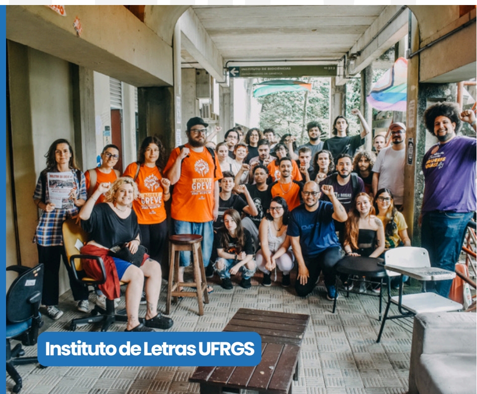
Instituto de Letras UFRGS

Diferente do que o governo vem divulgando, o Acordo de Greve de 2024 não foi cumprido. Dos itens assinados, 18 pontos continuam pendentes, incluindo a jornada de 30 horas universal e a inclusão real de aposentados e pensionistas nos avanços da carreira. Não aceitaremos que conquistas no papel sejam descaracterizadas na prática!