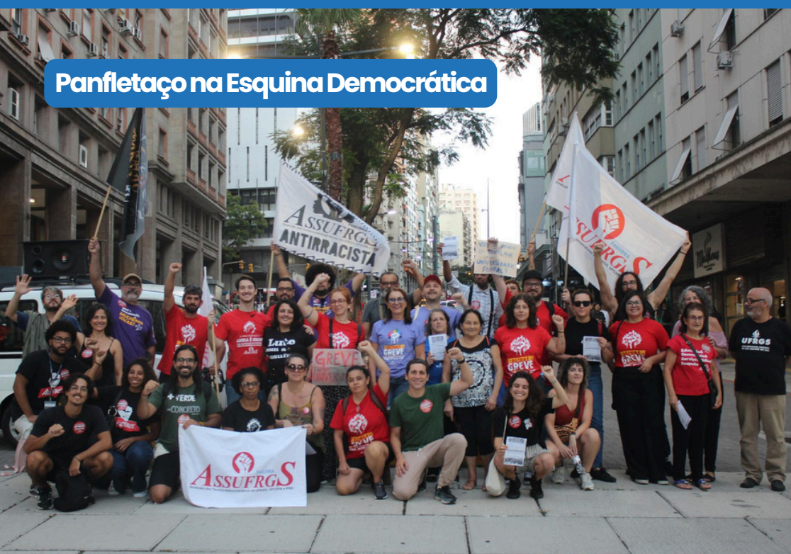
Panfletação na Esquina Democrática