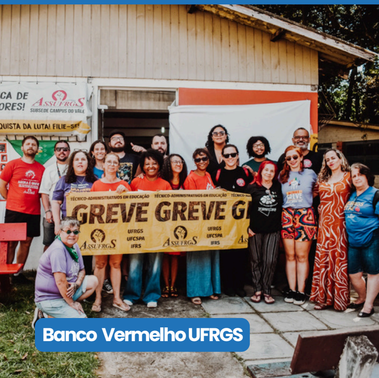
Banco Vermelho UFRGS